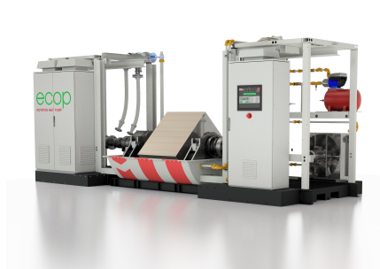
Rotation Heat Pump